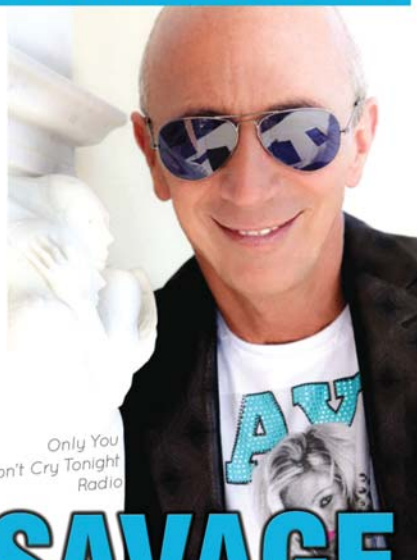
Only You Don't Cry Tonight Radio