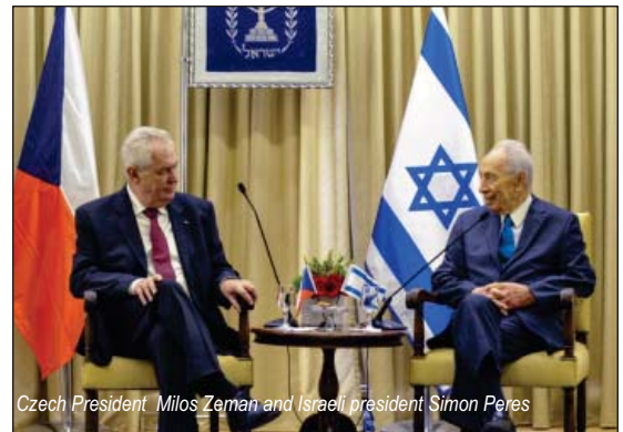
Czech President Milos Zeman and Israeli president Simon Peres