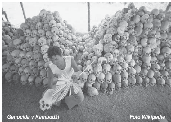
Genocida v Kambodži