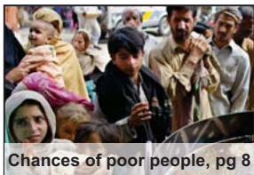
Chances of poor people, pg 8