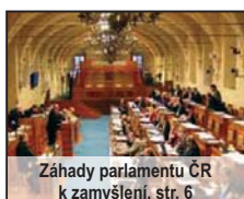
Záhady parlamentu ČR k zamyšlení, str. 6