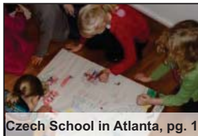
Czech School in Atlanta, pg. 1