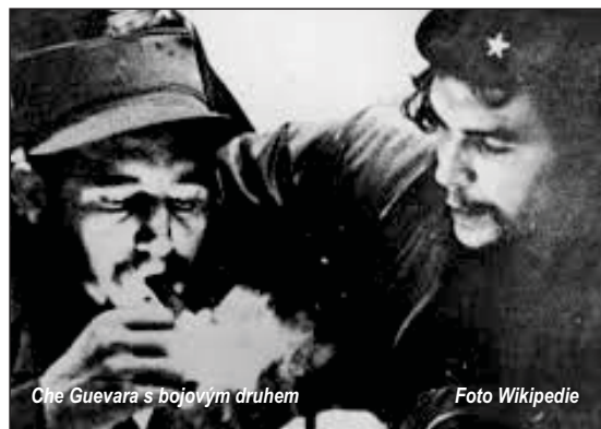
Che Guevara s bojovým druhem

V šedesátých letech onoho našeho dvacátého století se mi podařilo doklopýtat k promoci krátce před tím, než se revolučně zakalení studenti pustili do řádění. Na Kolumbijské univerzitě v New Yorku přepadli děkanát, zdevastovali interiér, nechali se fotografovat v kožených fotelech, nohy na mahagonových stolech. Poté,