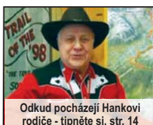
Odkud pocházejí Hankovi rodiče - tipněte si, str. 14