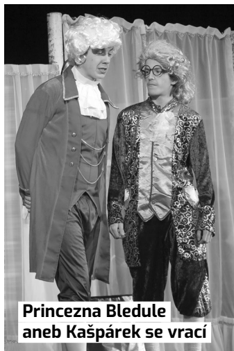
Princezna Bledule aneb Kašpárek se vrací