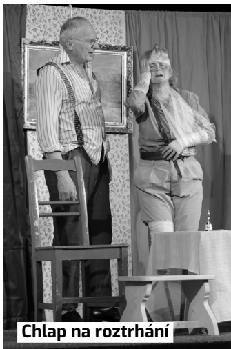
Chlap na roztrhání