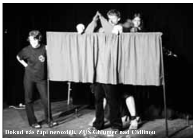
Dokud nás čápi nerozdělí, ZUS Chlumeč nad Cidlinou

Je nesporně dobrým nápadem vybrat si pro děti žánr detektivky. Ale v jeho realizaci sledujeme v inscenaci Čmukařů řadu problémů, které jsou podle našeho názoru převážně dramaturgicko režijního charakteru. Nejsou zcela jasně definovány postavy. Jaká je vlastně čarodějnice Sáva? Proč kladě detektivovi překážky? Jen pro své potěšení nebo má nějaký důvod a má být jeho záporným protikladem a soupeřem? A kdo je vlastně vypravěčem příběhu? Taky trochu zaniká „zmanipulovanost“ koček. Čokoládové kočičí jazýčky jsou nám jasné od počátku. A proč úvodní módní přehlídka? Neorientujeme se zcela. Přitom v detektivce, aby nás bavila, měli bychom být ve znalosti vývoje příběhu krok před detektivem nebo alespoň stejně s ním. To se nedaří. Ztrácíme se ve spoustě drobných dějových zápletek. Ale některé jednotlivosti nás baví – Dřimal. Celek bohužel působí poněkud unaveně a přímo zdoluhavě.