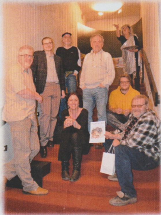
Zmatkaři z Dobronína — jediný soubor, který dovezl do Písku drama.