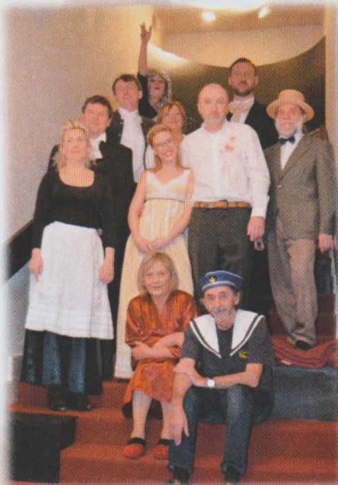
Prácheňská scéna naplnila hned dopoledne velký sál Podčáry.

Její utrpení netrvá dlouho – díky pracovníkovi úřadu, který si rád „tak trochu přihne“ se začne na pódiu rozehrávat neuvěřitelná show. Z mladičké manželky se rázem stává dcera. Z tchýně manželka, ze zetě manžel, z manžela otec. Přijde vám to dostatečně zamotané? Prácheňská scéna nemá absurdních životních situací dost, proto divákovi servíruje další nálož v podobě ztraceného manžela bývalé tchýně, nynější manželky pana Barillona a matky slečny Virginie.