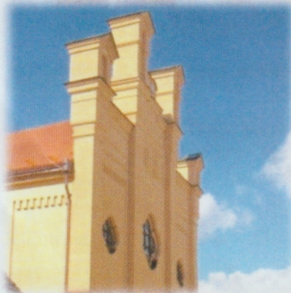
Synagoga v Soukenické ulici v Písku

ELEKTRÁRNA KRÁLOVSKÉHO MĚSTA PÍSKU — muzeum u řeky Otavy