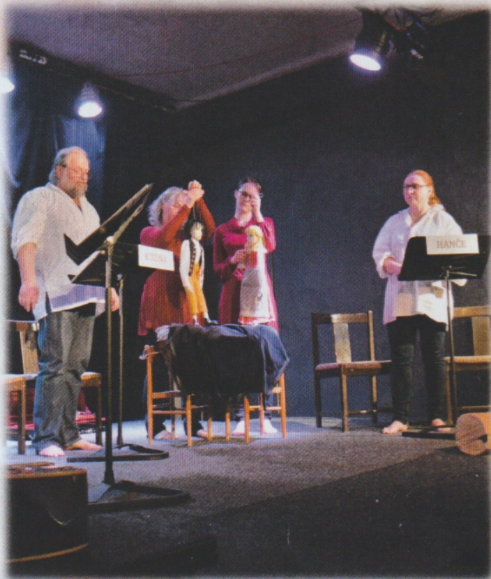
Ochotníci z Domažlic obohatili festival o scénické čtení.