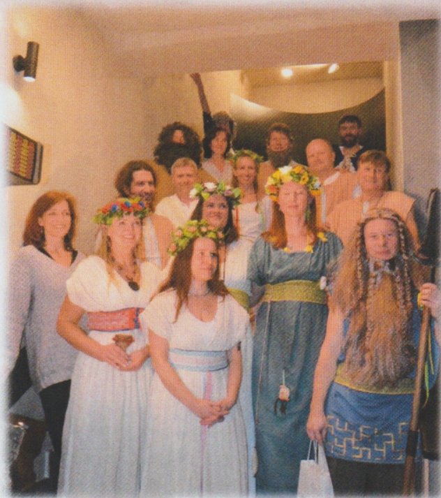
Divadelní spolek Šemík zcela zaplnil červené schody.

Šemík je nejmladším souborem na přehlídce – jaké jsou vaše vize? A kde se vidíte za deset, dvacet let?