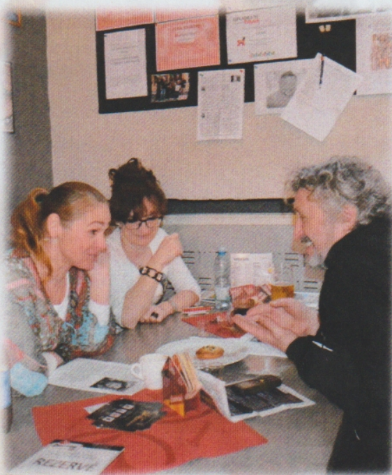
Porota festivalu v akci