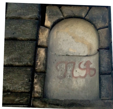
> Číslo popisné zámku