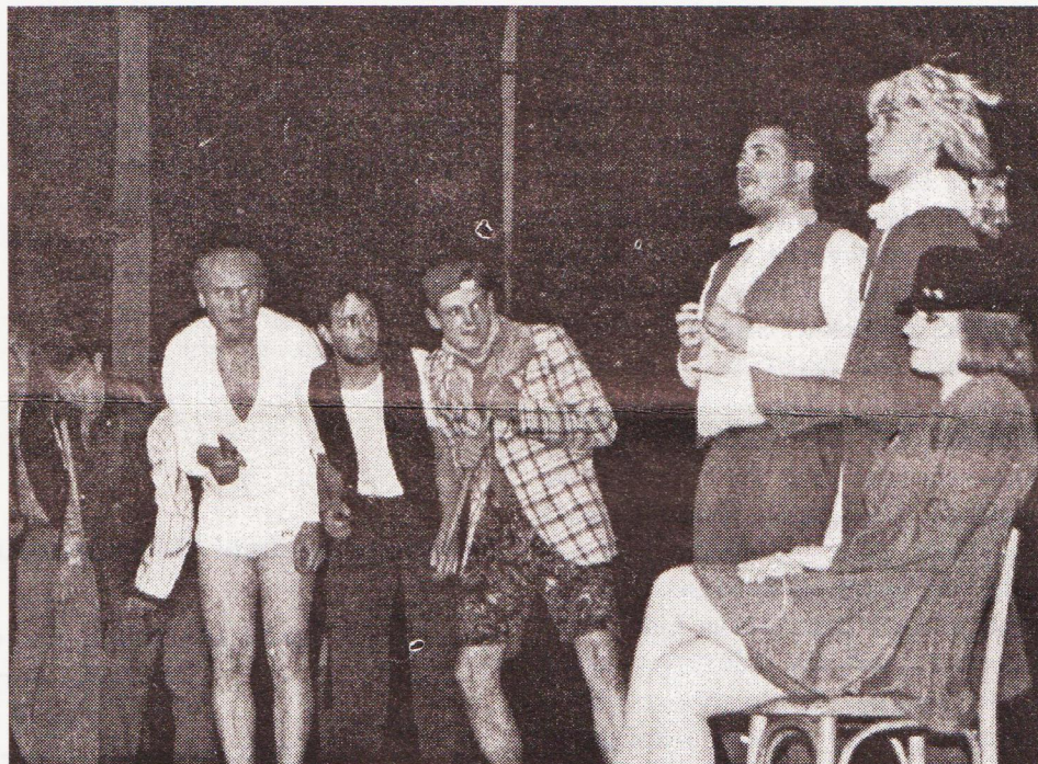
Lucerna v podání Netrdla