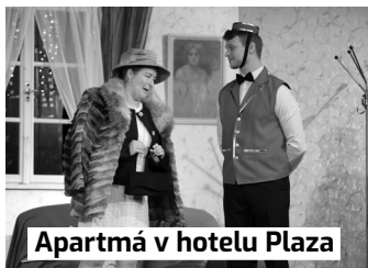
Apartment v hotelu Plaza