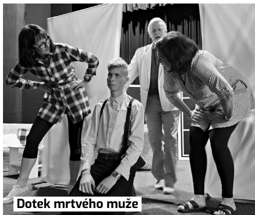
Dotek mrtvého muže