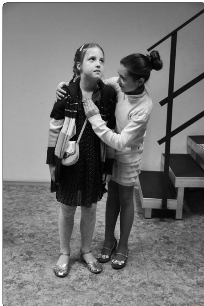
Běčka a Simča: Objeví Káje a Královny, která mu zmrazuje srdce. To nám přijde jako podstata celého příběhu!

Každý máte slovo. Ale jen jedno! aneb Miň slov víc ví? aneb Anonymní divácký asociativní sloupek