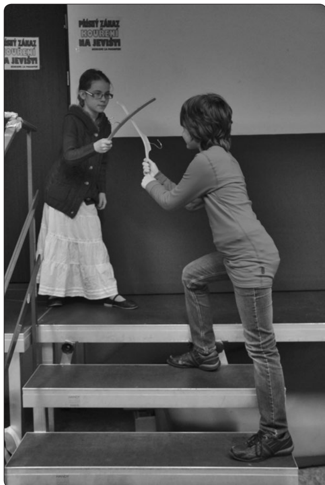
Anička a Evča: Obraz princezny a prince, kteří spolu šermují. Super je to, že princezna zvládne s princem šermovat!