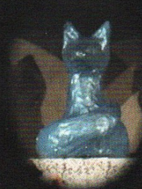
Modrá liška Modrá liška