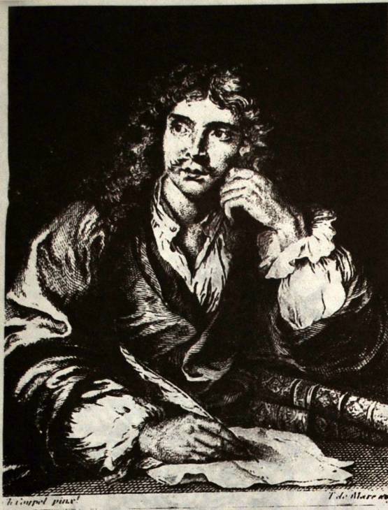
T. de Mare: Molière.