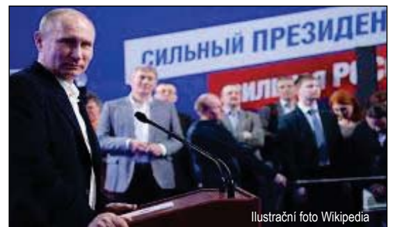
Ilustrační foto Wikipedia

Zvolení Zemana na druhé prezidentské období je v Česku i v mezinárodním hodnocení vykládáno jako příklon k východu v osobě prezidenta; ale skutečnost se jeví jinak, když hacker uvězněný v Praze pro internetové sabotáže byl požadován nejen soudci v Rusku, ale i soudy v USA o vydání a potrestání, a předečirem byl vydán a transportován do USA letounem Ministerstva spravedlnosti USA, což je zjevný příklon české justice k západu navzdory přání prezidenta, který přesvědčoval soud, aby uklidil sabotážera do Moskvy. Jestliže Putin považuje bývalé země varšavské smlouvy za svou tradiční sféru vlivu a tyto země za potenciální vazaly Kremlu, pak se mylí, protože bývalí nevolníci sovětské říše okusili svobodu a chtějí ji mít, a v této věci spočívá naděje, že sovětský sen je snem vzdalujícím se jakékoliv praktické skutečnosti. Příští rok ukáže, jestli se Putin přeonačí na bezzubého cara anebo potrestá svůj sklíčený národ diktaturou brežněvovského druhu; nakonec Putin je už u kormidla déle než byl Brežněv, a poslední roky brežněvismu si pamatujeme, jaká to byla ostuda a příprava na rozpad sovětské říše, která měla trvat navěky. ■