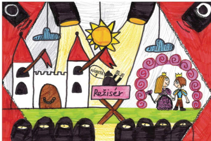
Viktoria, 4.B, ZŠ Sázava