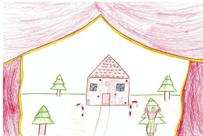
Kája, 4.A, ZŠ Plaňany