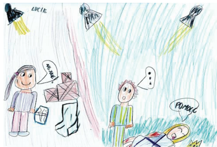
Lucie, 4.A, ZŠ Plaňany