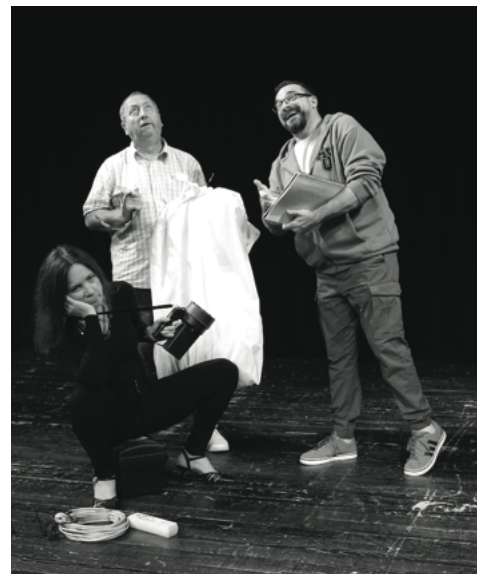
/nenařazený technik; našťavý kostýmář; ambiciózní nápověda