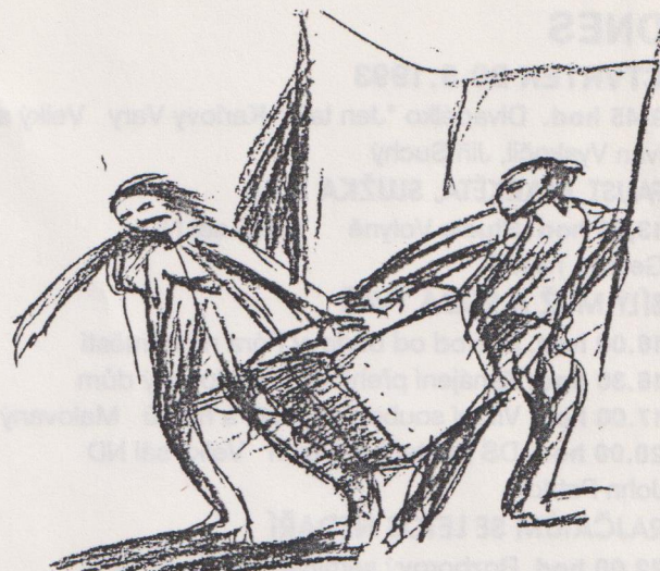
P. Weiss - Tři chodci

kresba úhlem Alexandra Müllera, studenta třetího ročníku scénografie JAMU.