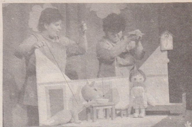
Foto z pohádky O Budulínkovi

divadelní soubor Tyl SKP LIAZ Mnichovo Hradiště. Soubor, který se v posledních letech na krajské přehlídce představuje pravidelně, letos to bude podesáté. Dvakrát v soutěži zvítězil /1984, 1985/. Dramaturgie tohoto kolektivu je na vysoké úrovni, což potvrzuje i soutěžní titul. Přejeme amatérům z Mm. Hradiště hezký a úspěšný večer v Tylově divadle.