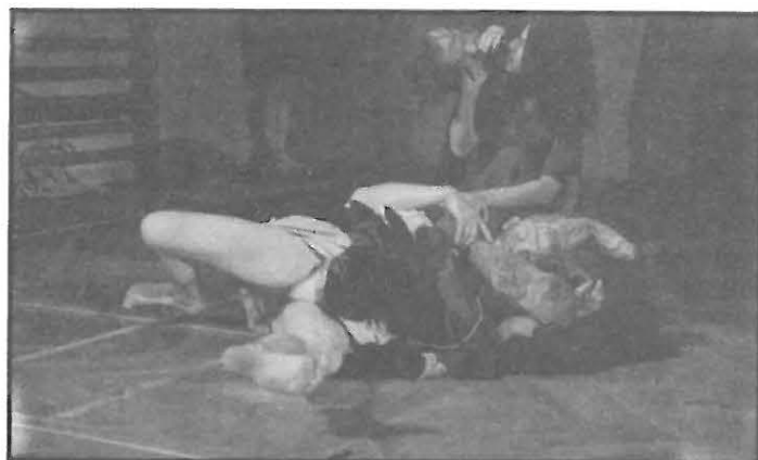
Kruh opsaný balvanem