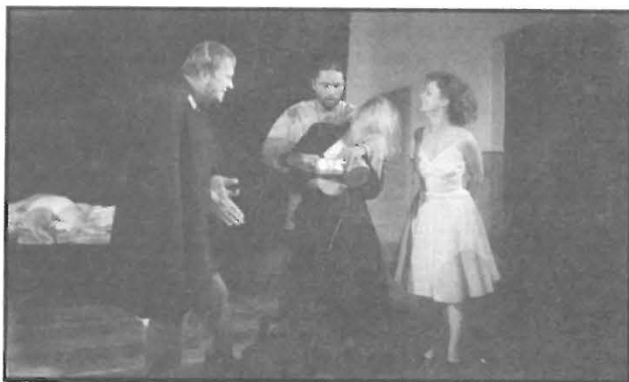
Hory se připravují k porodu, na svět přijde malá šedá myš