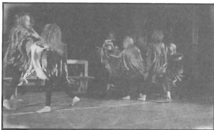
Pohádka o ptačí válce