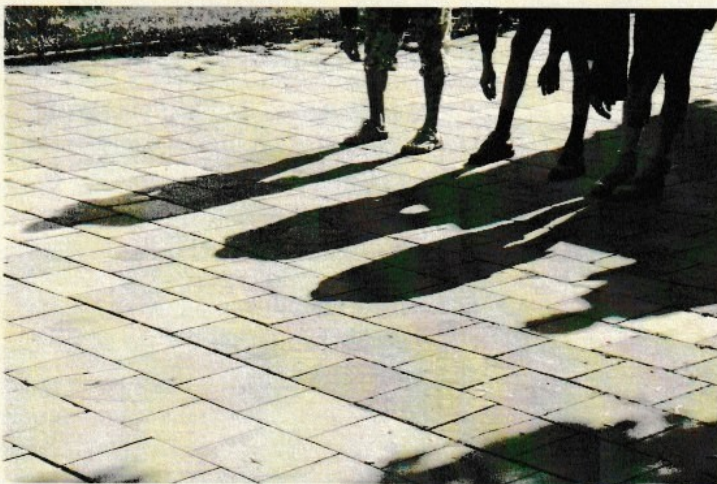
POKUS O PUČ ODHALEN! Toto nejsou Šedows!!!