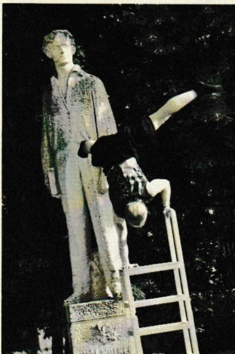
BOMBA!!! Artista ukázal zblízka našemu básníkovi, co v něm klíčí!!! Je to básnické střevo?

ŠOK! Marně čekaly desítky účastníků WP na pravidelný spoj na trase DUHA-Městské divadlo. Stávka dopravců dorazila do Prostějova o dva dny dříve! Vina padá na hlavy redakce Wolkroniqu. Ten už v úterý měl neděli. A tím předčasně nastartoval odboráře.