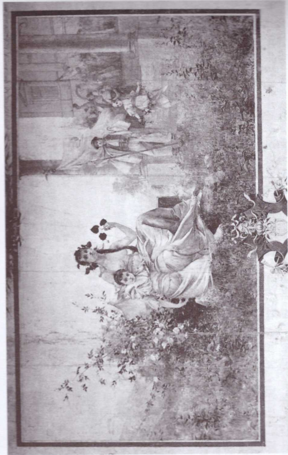
Obr. 1. Opona Karla V. Maška z roku 1891.