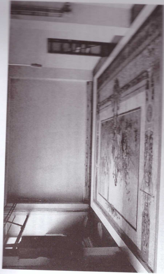
Obr. 3. Opona Karla V. Maška počas reštaurátorských prác, po nažehľení na nové plátno.

Prvým záchranným krokom bolo celoplošné upevnenie lokálnym priliepaním uvoľnenej maliarskej vrstvy k plátennej podložke 5% želatínou s pridaním hrebíčkového oleja