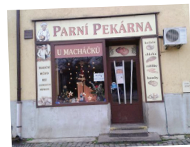
> Pekařství U Macháčků

44. ročník divadelního festivalu FEMAD s podtitulem Salón odmítnutých pořádá Divadelní spolek Jiří Poděbrady a Městské kulturní centrum Poděbrady.