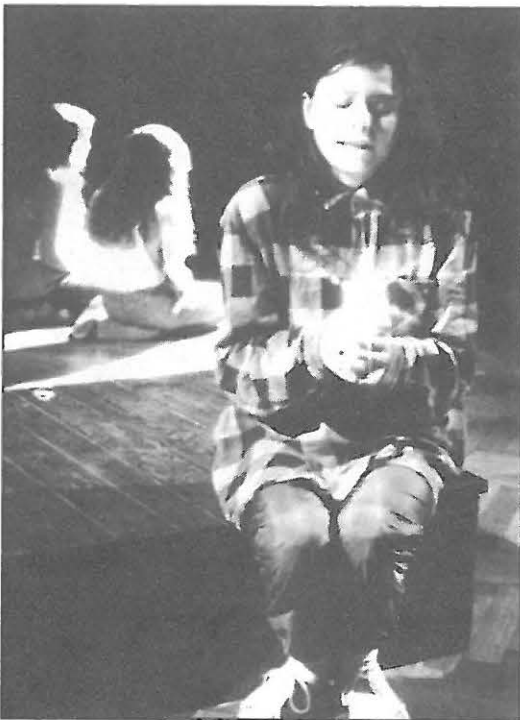
Z představení Ledový zámek - Divadelní soubor HUDRADLO Zliv

Dalo by se možná mluvit o dílčích problémech inscenace. Příznám se, že v tomto okamžiku (těž coby matka dvanáctileté dcery) jsem zasažena emocemi natolik, že se mi prostě nechce rozebírat. Chápejte, to nejsou jen emoce vyvolané příběhem, představením, nejednou prostě závidím těm holkám jejich svobodu na jevišti,