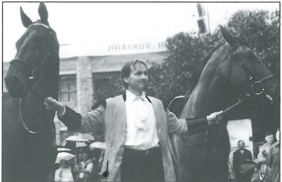
Snímek ze slavnostního zahájení 66. Jiráskova Hronova