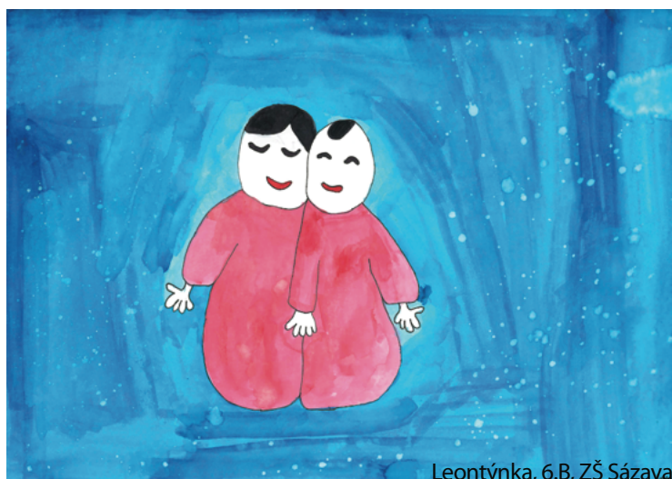
Leontýnka, 6.B, ZŠ Sázava