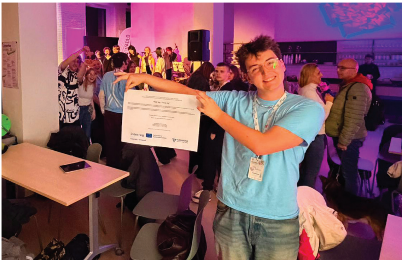
... papír na koncertě