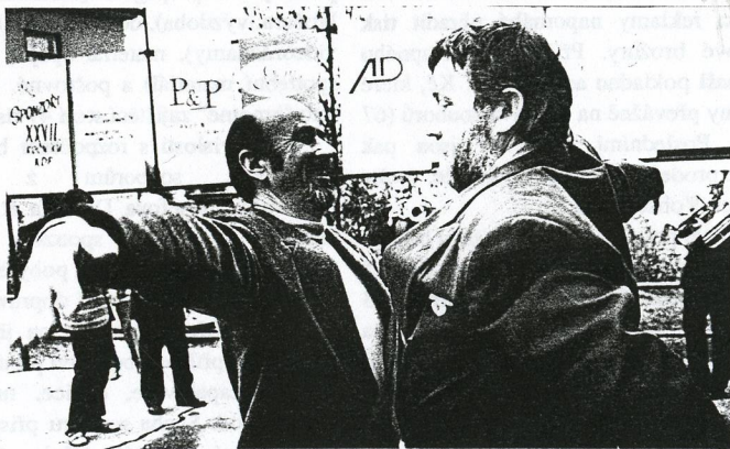
Tak za rok zas!

všem, kdo se jakýmkoliv způsobem podíleli na financování, přípravě a průběhu letošního Krakonošova divadelního podzimu.