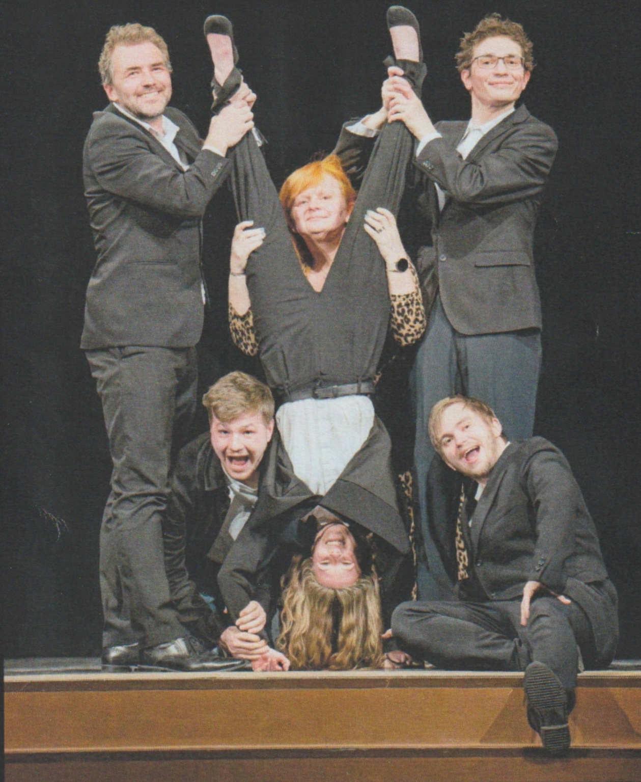
Spolek divadelních ochotníků Alois Jirásek ( www.divadloupice.cz ), duben 2025, fotografie: Ctibor Košťál ( www.ckostal.cz )