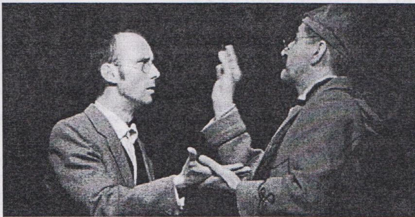
Divadlo AHA! Lysá nad Labem na loňské DT uvedlo dvě inscenace - snímek nám připomene inscenaci Mrožkova Tango

Divadlo AHA! z Lysé nad Labem vystupovalo na třech předchozích ročníkách Divadelní Třebiče - v loňském roce dokonce uvedlo dvě inscenace ( Genetovy Služky a Tango S. Mrožka ). Letos se představí s inscenací hry Daniely Fischerové Náhle neštěstí .