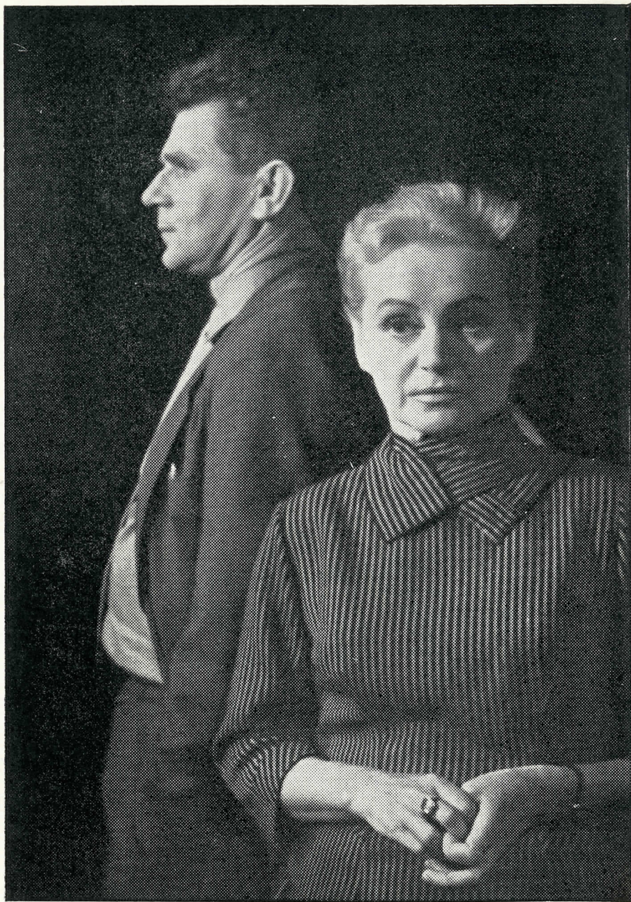
OLDŘICH DANĚK POHLED DO OČÍ