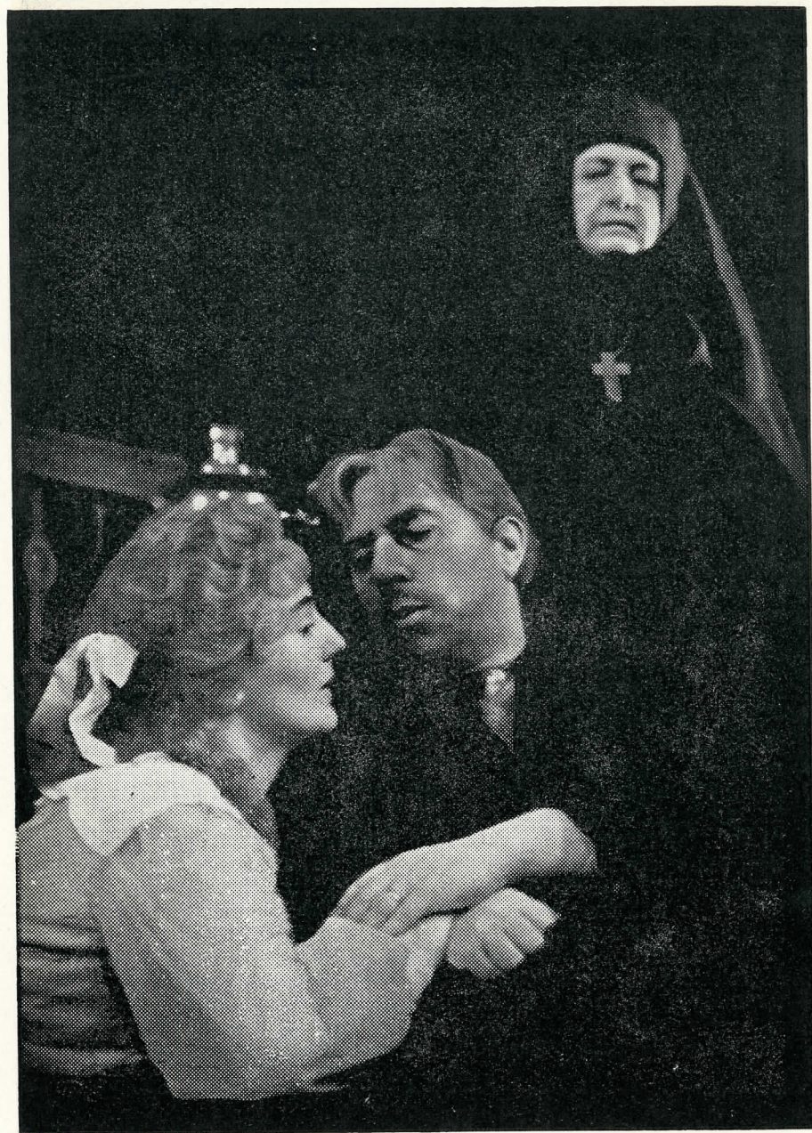
MAXIM GORKIJ JEGOR BULYČOV A TI DRUŽI