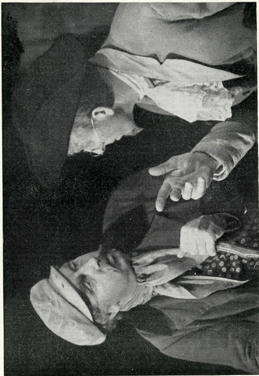
ALOIS JIRÁSEK PAN JOHANES