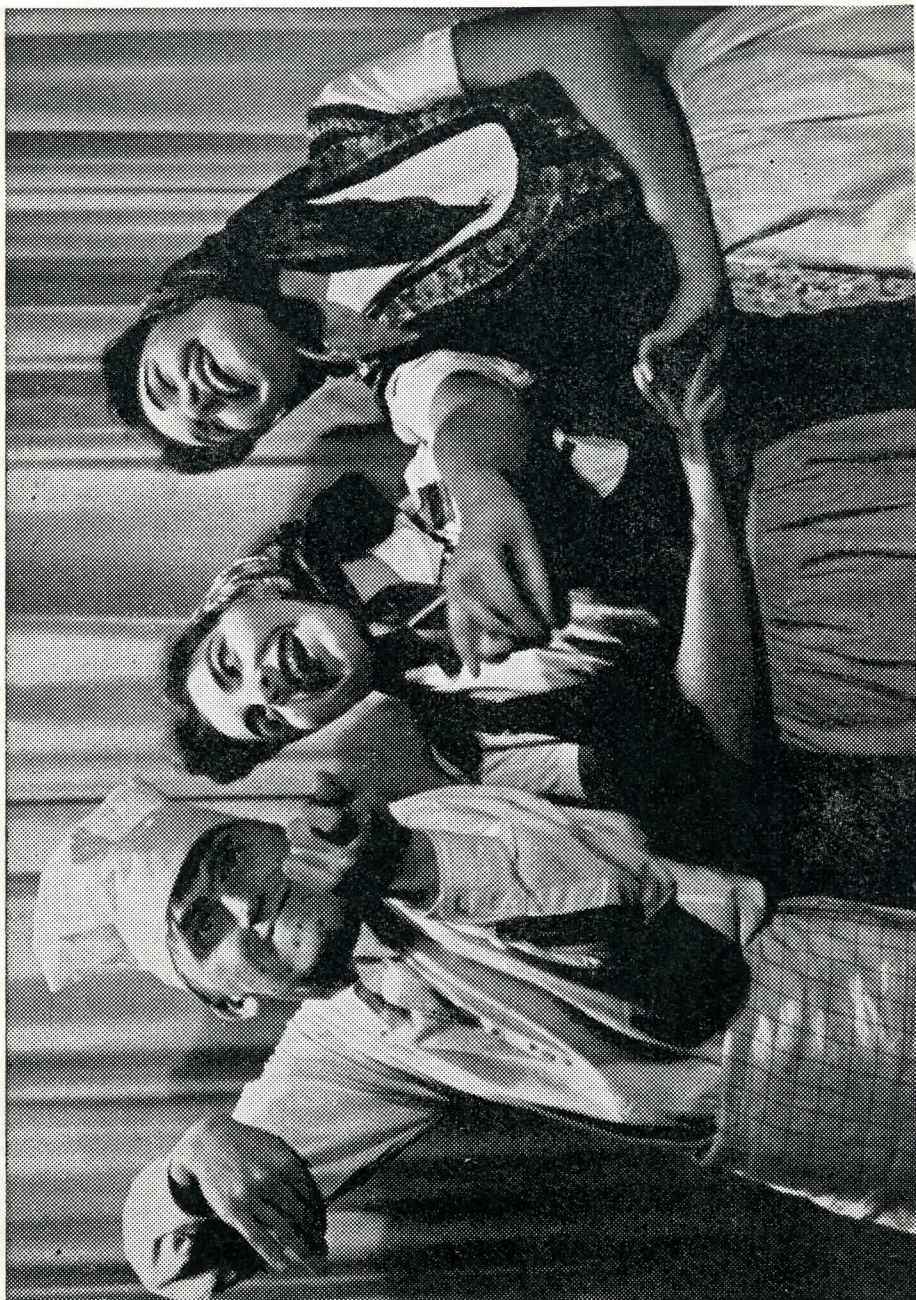
KABARET NECHTE SI CHUTNAT