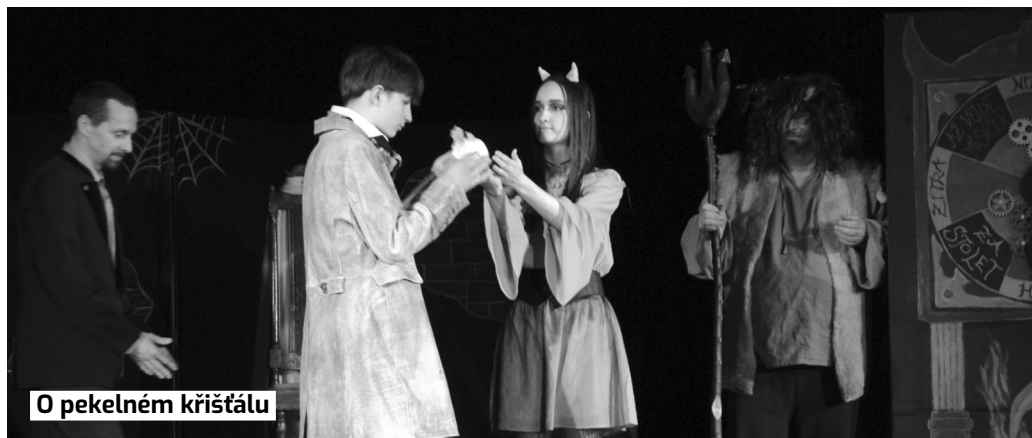
O pekelném křišťálu