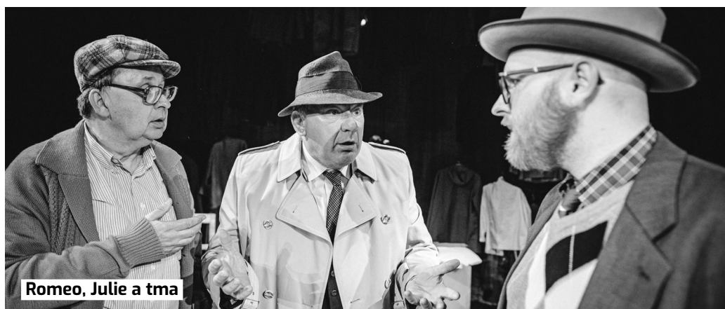
Romeo, Julie a tma