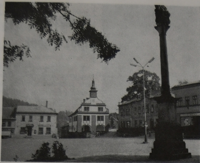
Historická budova radnice, kde před 150 léty zhlédli úpičtí občané první hru v nastudování místních ochotníků.