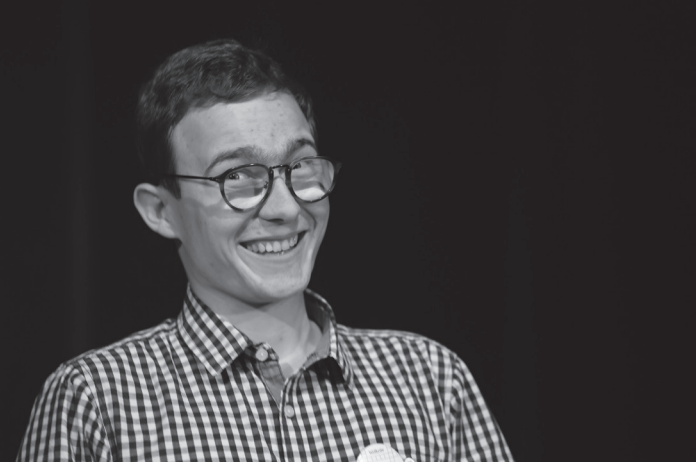
recitátoři 3. kategorie