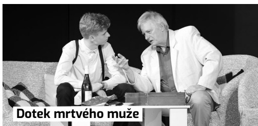
Dotek mrtvého muže