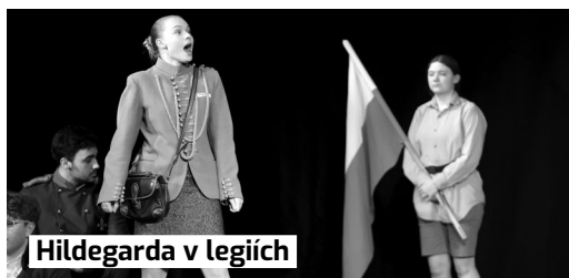
Hildegarda v legiích