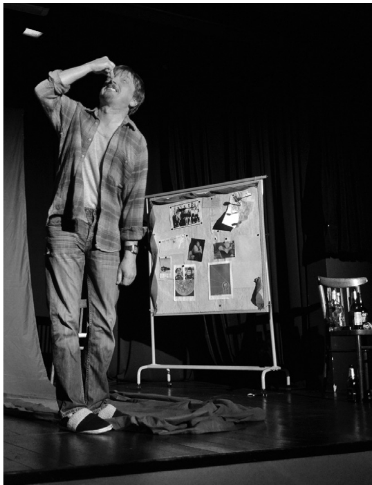
Člověk riskuje životní prohry tím, že se narodí.

René Vápeník: Nebylo by zcela korektní nezmiňt úctyhodný výkon představitel. Nebylo by zcela poctivé neptat se po větší nápaditosti, překvapivosti a větším tahu na bránu.