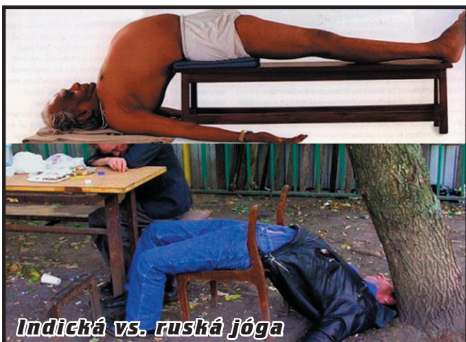
Indická vs. ruská jóga