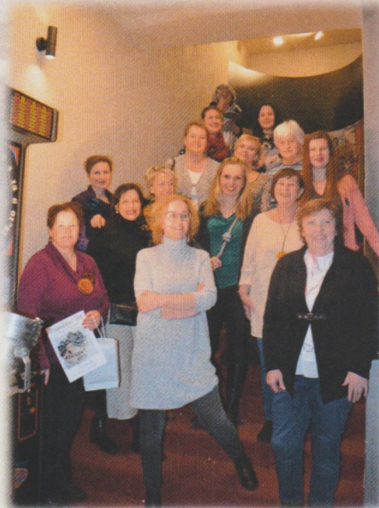
ŽAS na červených schodech slávy...

Poslali nám dotazník ať se představíme pozvali nás do Písku ať je pobavíme kde bereme inspiraci jaké ženy jsme my jim předvedeme jak jsme úŽASné nás pohání vítr monzun někdy taky bóra hrajem vždycky s velkou chutí neděláme fóra