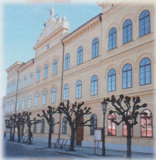
Městská knihovna Písek

MĚSTSKÁ KNIHOVNA—knihovna roku 2019, v sobotu otevřena od 9-16 h