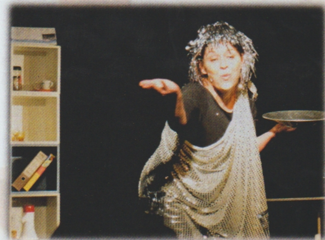
Stříbrný vítr naděluje úsměv a radost...