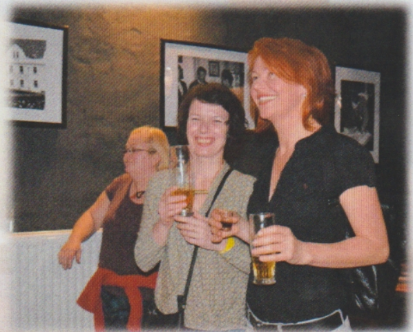
... může se to stát i vám...