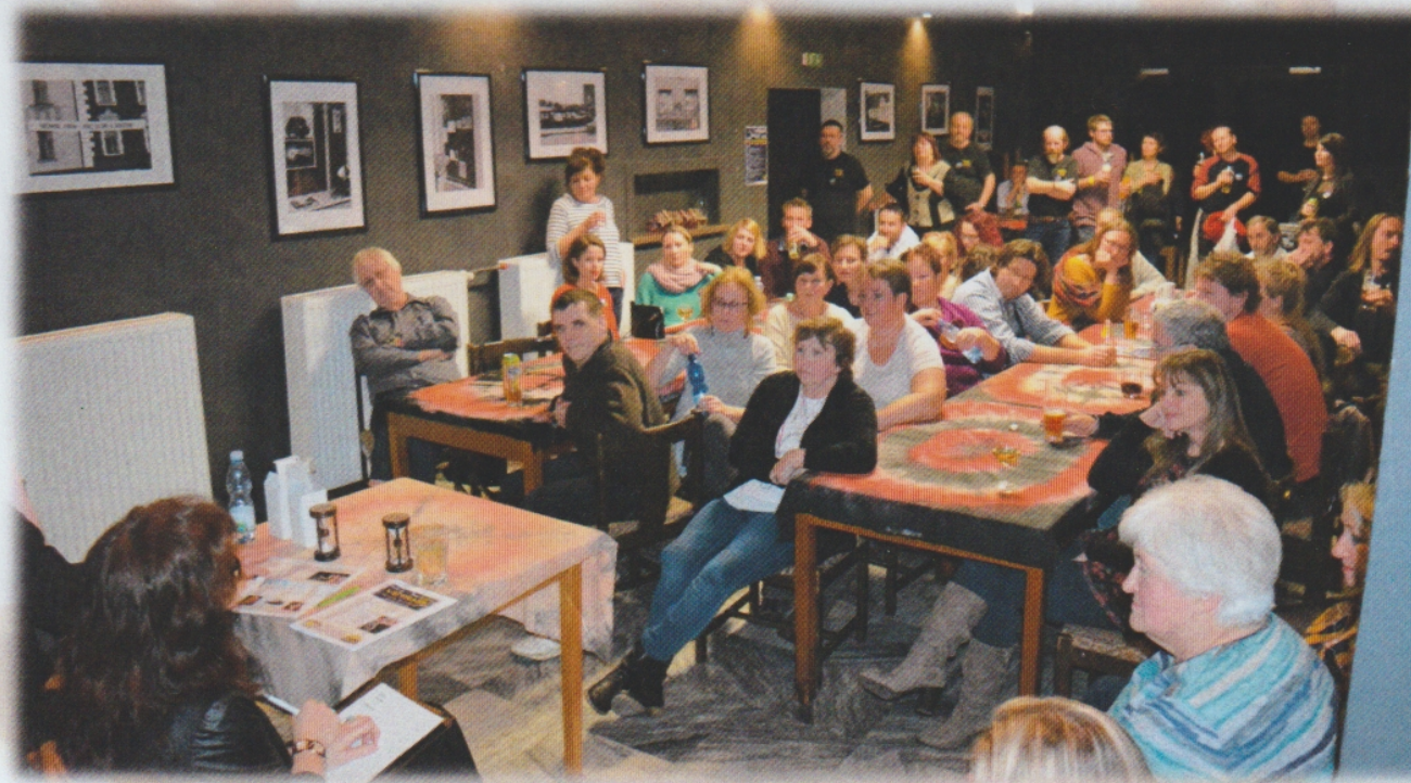
Diskuse s porotci festivalu za rytmu přesýpacích hodin se nesla v uvolněné atmosféře.

U stříbrného větru samozřejmě Šrámek. U Písku jsou to krásné vzpomínky na řadu vystoupení na festivalu Šrámkův Písek.