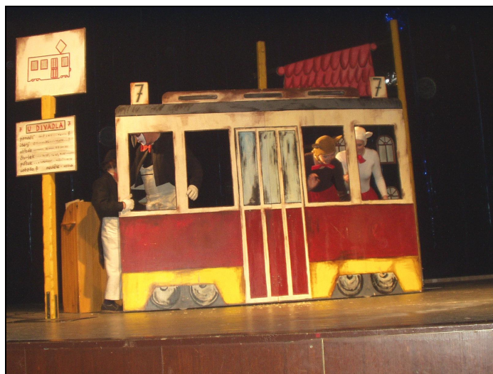
< Tramvaj z představení