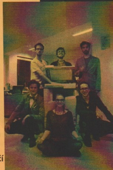
redakce se loučí