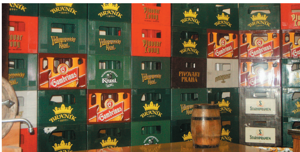
Příprava divadelních žní byla náročná na pitný režim. Zbylé basy pak posloužily jako výzdoba Hospůdky pod lípou v kláštereckém kulturáku.

U výstavy se trochu pozastavíme, neb je zapotřebí