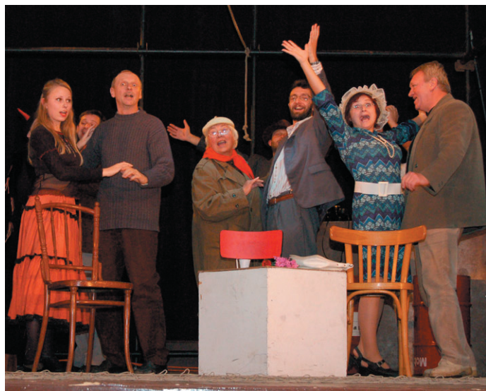
Radost herců před přestávkou neznala mezí. Jak na tom byli diváci nebudeme raději komentovat.