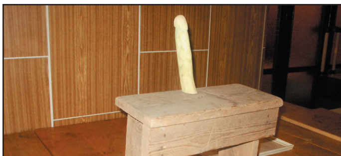
Takto vypadala původní stolička česaček chmele, kterou bohužel na výstavě nevidíte.

Pro ostatní návštěvníky žní máme dobrou zprávu. Exponát nakonec na výstavě uvidíte. Chybějící část laskavě doplnil ze svých soukromých zásob Václav Štauber.