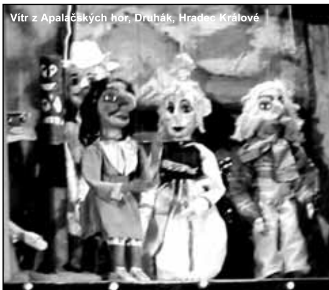
Vitr z Apalačských hor, Druhák, Hradec Králové