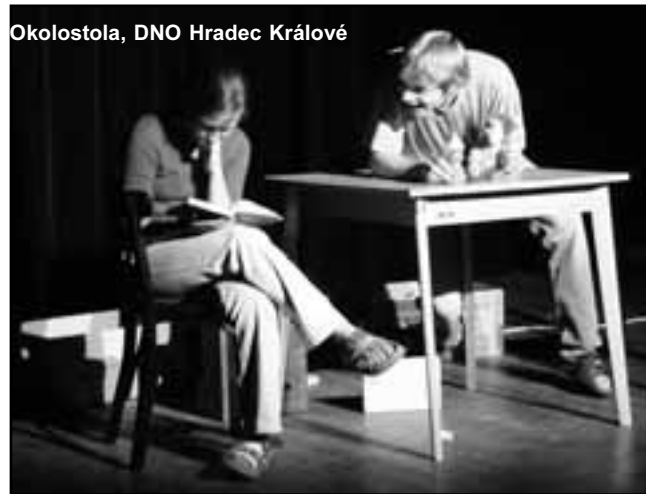
Okolostola, DNO Hradec Králové