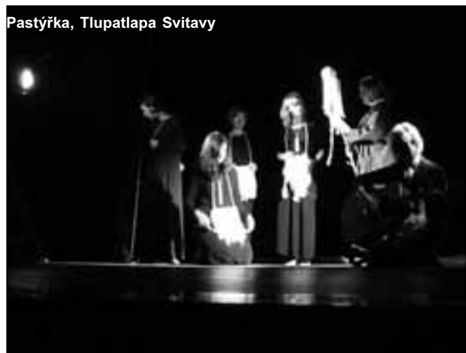
Pastýřka, Tlupatlapa Svitavy