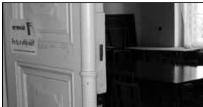
Seminář F - Pro ty, co chtějí vědět

- já jsem ještě taková neprobuzená, ale myslím, že to bylo docela pěkný - loutky se mi líbily, ačkoli musím říct, že nezvládali úplně mluvení, to neutáhli - ty říkáš mluvení, tam byl problém s voděním, jak ty loutky nastupovaly a jak chodily, vůbec neměly podlahu, nepoužívaly nohy, ale ty loutky byly fakt pěkný, - nelíbilo se mi to, - veliká sranda, - trochu mne to uspalo, - nudný, nezábavný a chvílema i trapný, - nechytlo mne to, - výtvarně se mi loutky líbily