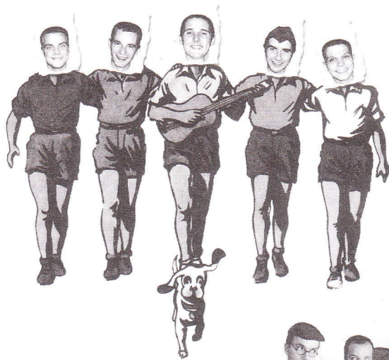
Slovácké divadlo Uherské Hradiště Jaroslav Foglar, Robert Bellan - Rychlé šípy