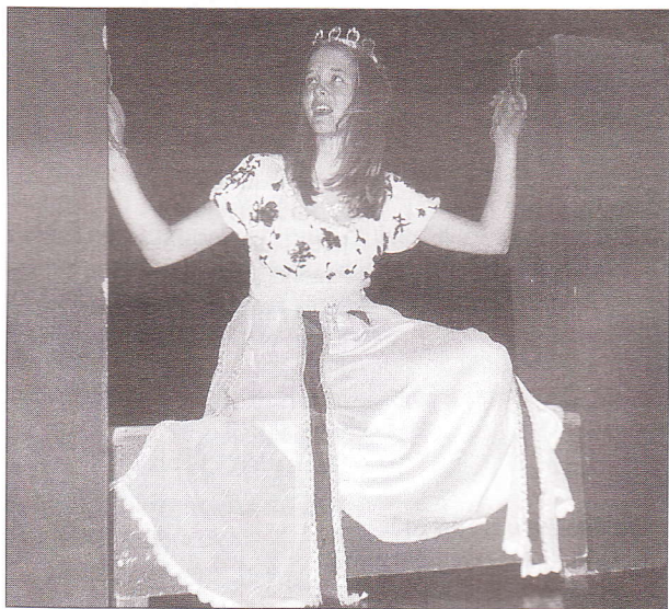
Divadelní soubor Rachtámibltník Praha Božena Němcová – O Slunečníku, Měsíčníku a Větrníku

Samotný život Boženy Němcové nebyl příliš šťastný. Její muž, Josef Němec, byl úředník finanční stráže, často se stěhovali a za bachovské reakce byl Josef Němec propuštěn ze státních služeb a rodina žila v bídě. V Praze žila Němcová v prostředí vlastenecké kulturní společnosti, byla členkou Českomoravského bratrstva, usilujícího o spojení Čech a Moravy a sledovala dobové sociální hnutí. Na sklonku života byla nemocná a zemřela v chudobě.