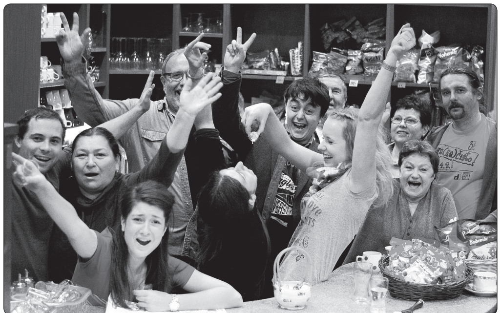
Tyláci se na Popelku těší všemi deseti.