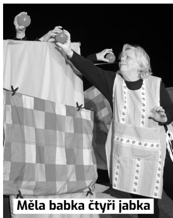
Měla babka čtyři jabka