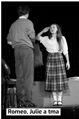
Romeo, Julie a tma