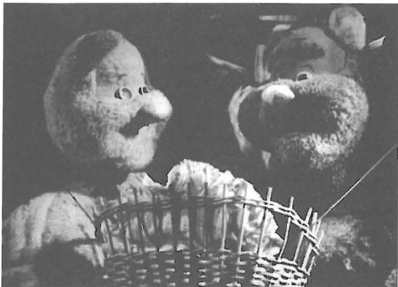
Loutkové divadlo Střípek, Plzeň: Brum - pohádka aneb Výchova medvědů v Čechách

Devět obrazů je za sebou zcela pokračování na str. 3