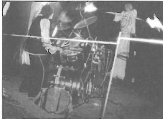
TEATR PRAWDZIWY, Bielawa, Polsko

To divadelníci z polské Bielawy přivezli do Hronova dárek onačejší. Vlastně je to takový dar - nedar. Těžko si někdo tu fascinující podívanou, kde se tanečníci na chůdách proplétali za rachotu bubnů mezi rozličnými rachejtlemi, schová někam do šuplíku. Sotva si starosta vystaví na poličku ty podivuhodné „azbestové“ ženy, které si bezstarostně pohrávaly s plameny, jako by to bylo prostírání na sváteční stůl.