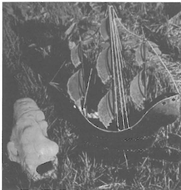
▲ Tot on - věhlasný Zlatý Alois

me, že loňský Alois stále čeká - t. č. v redakci hronovského Zpravodaje, až si ho vyzvedne někdo z Boleradic či jejich zákonný zástupce. A je mu smutno... (zat)