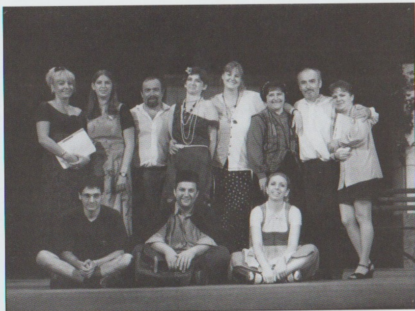
RODINA TÓTŮ 1998 - společné foto z Jiráskova Hronova