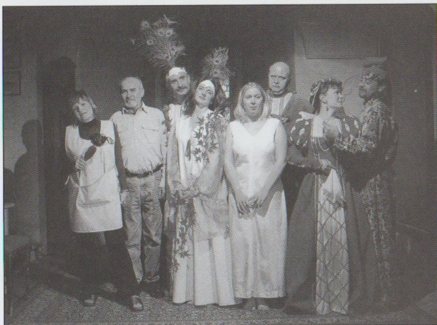
DĚKUJI VÁM, PANE SHAKESPEARE 2004 - společné foto