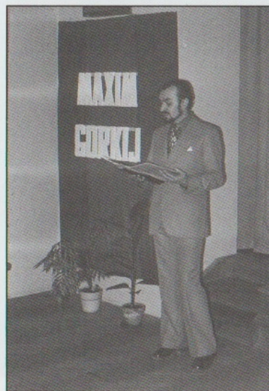
LITERÁRNÍ VEČER 1976