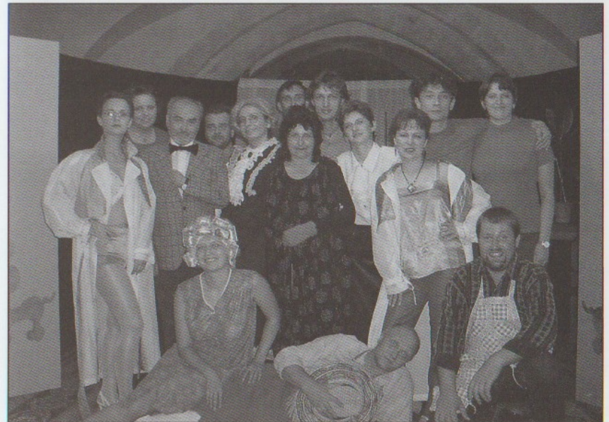
ŽENA V TRYSKU STOLETÍ 2002 - společné foto