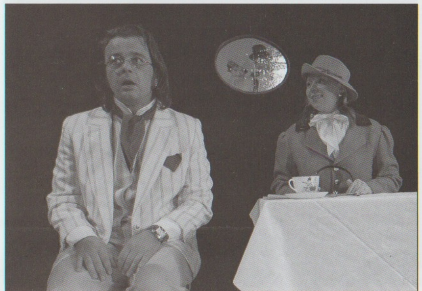
OTEC SVÉHO SYNA, ANEB, VŠE PRO FIRMU 2004 F. Zahrádka, P. Tauerová (Lišková)