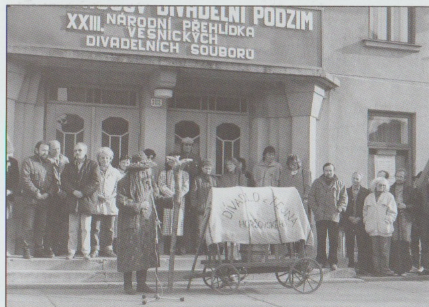
POPRVÉ VE VYSOKÉM NAD JIZEROU 1992 uvítání před divadlem Krakonoš