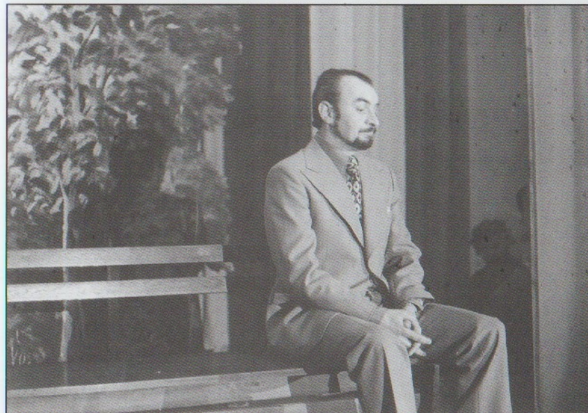
BAJKA O BOBROVI (ZUČ) 1977 - V. Kuneš