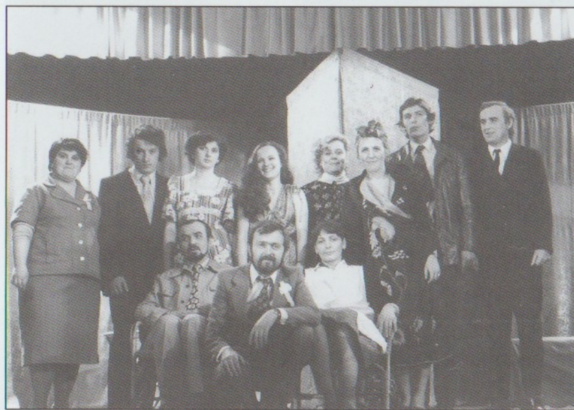
DŮM NA NEBESÍCH 1982 - poprvé na soutěži, společné foto