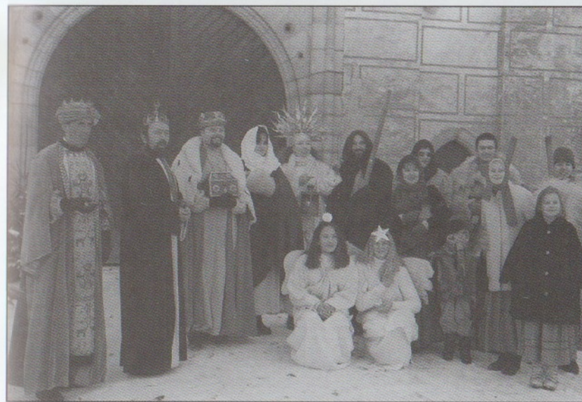
I. ŽIVÝ BETLÉM 1997