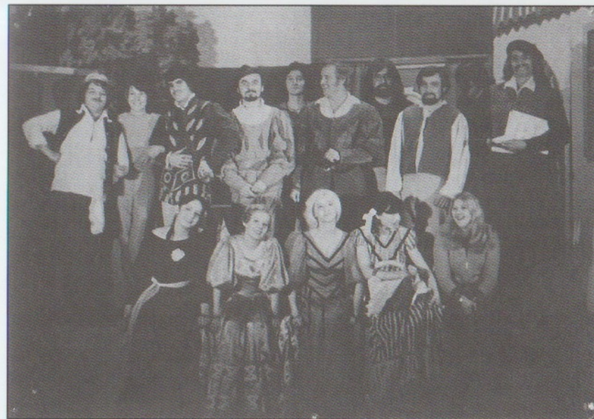
ÚSMĚVY A KORDY 1976 - společné foto