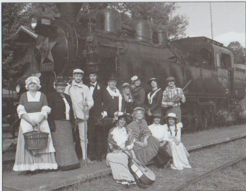
DEN ŽELEZNICE 2014 - společné foto