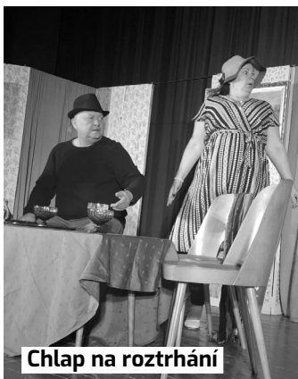
Chlap na roztrhání