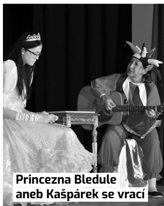
Princezna Bledule aneb Kašpárek se vrací