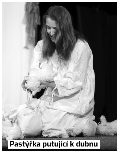
Pastýřka putující k dubnu