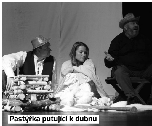
Pastýřka putující k dubnu