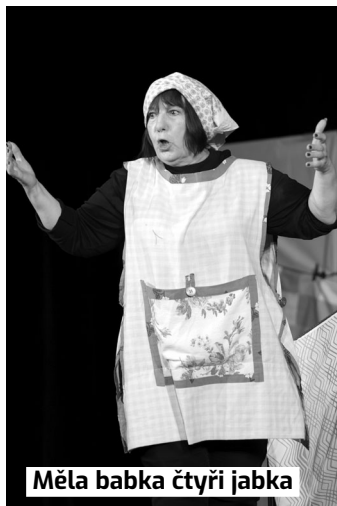
Měla babka čtyři jabka