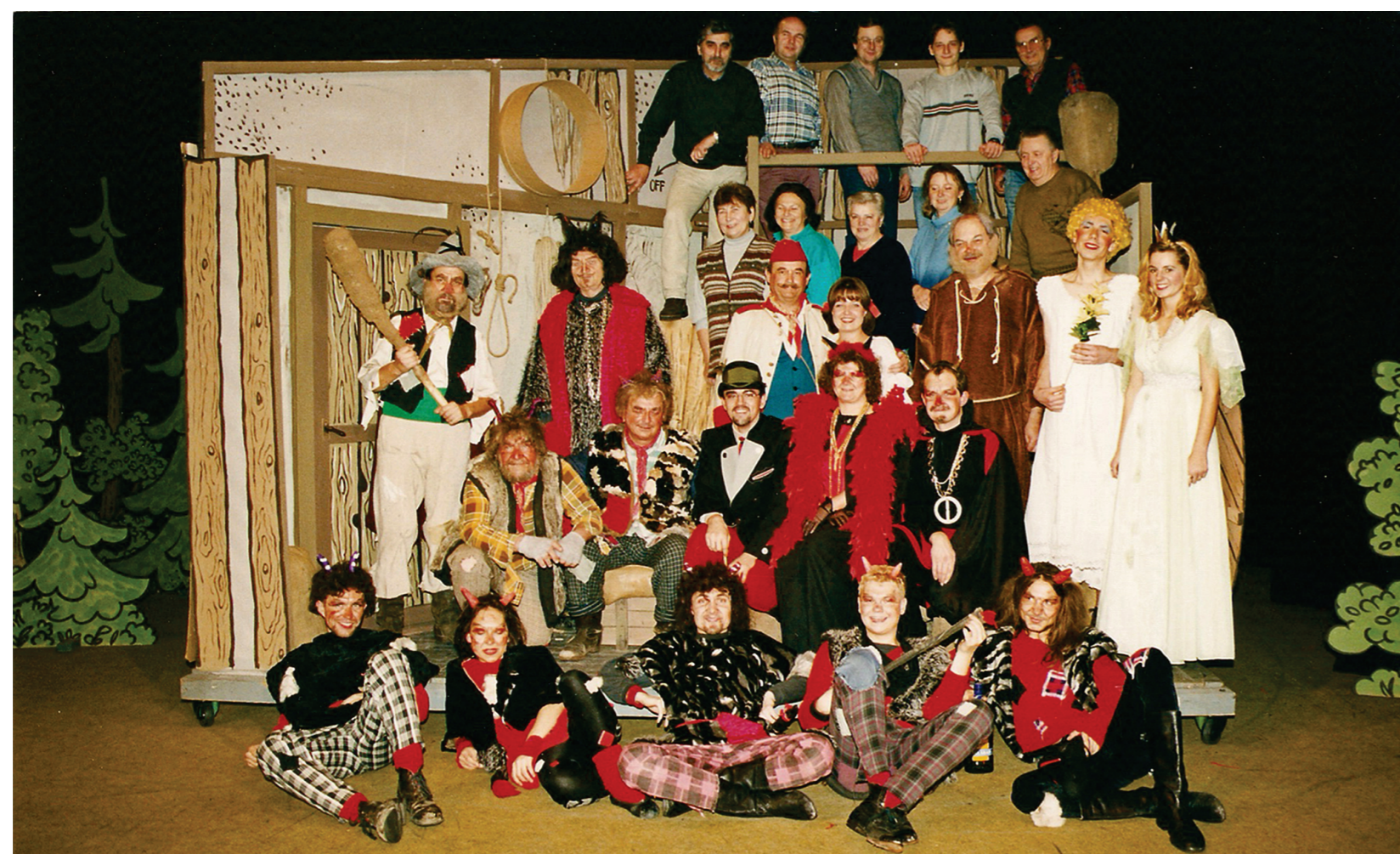
2000 - J. Drda: Hrátky s čertem