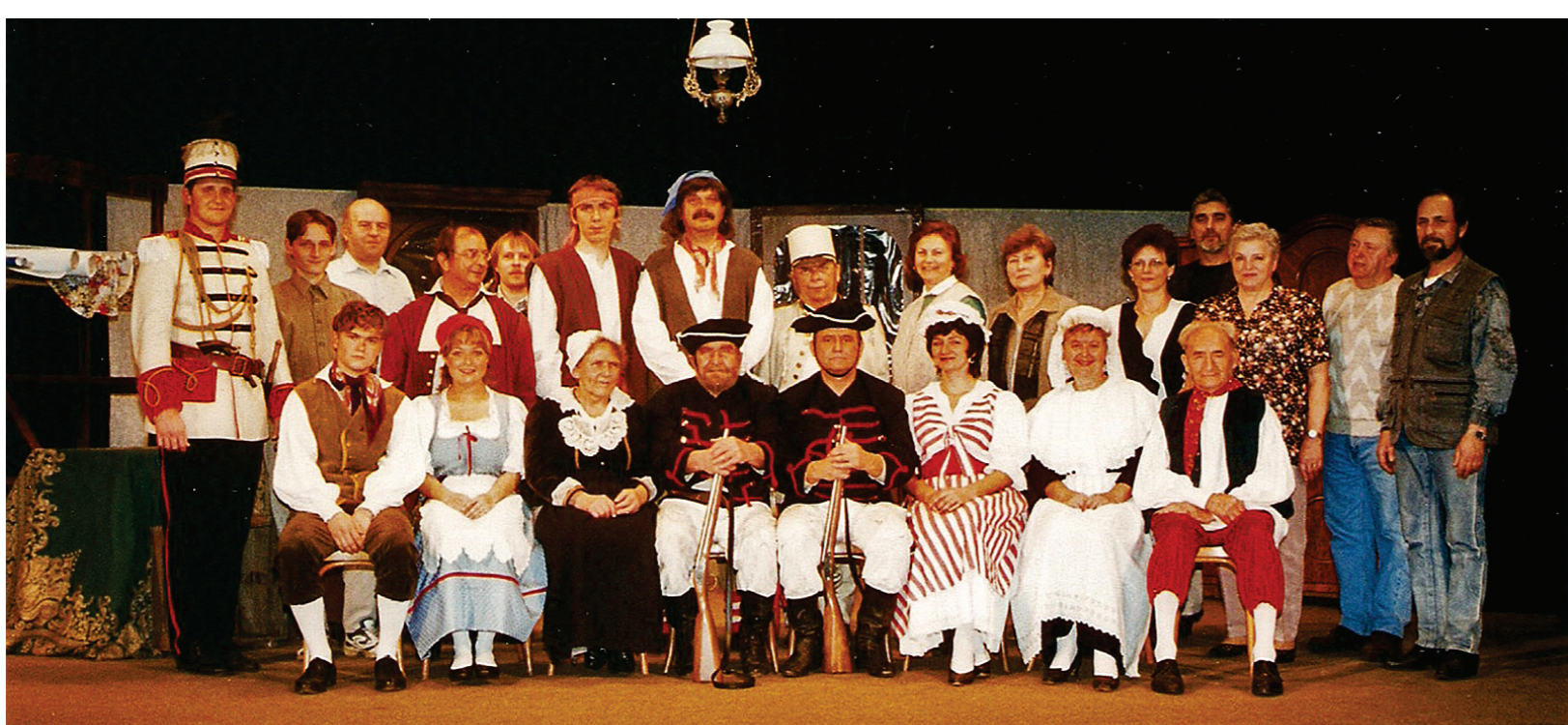
2001 - B. A. Bréal: Husaři