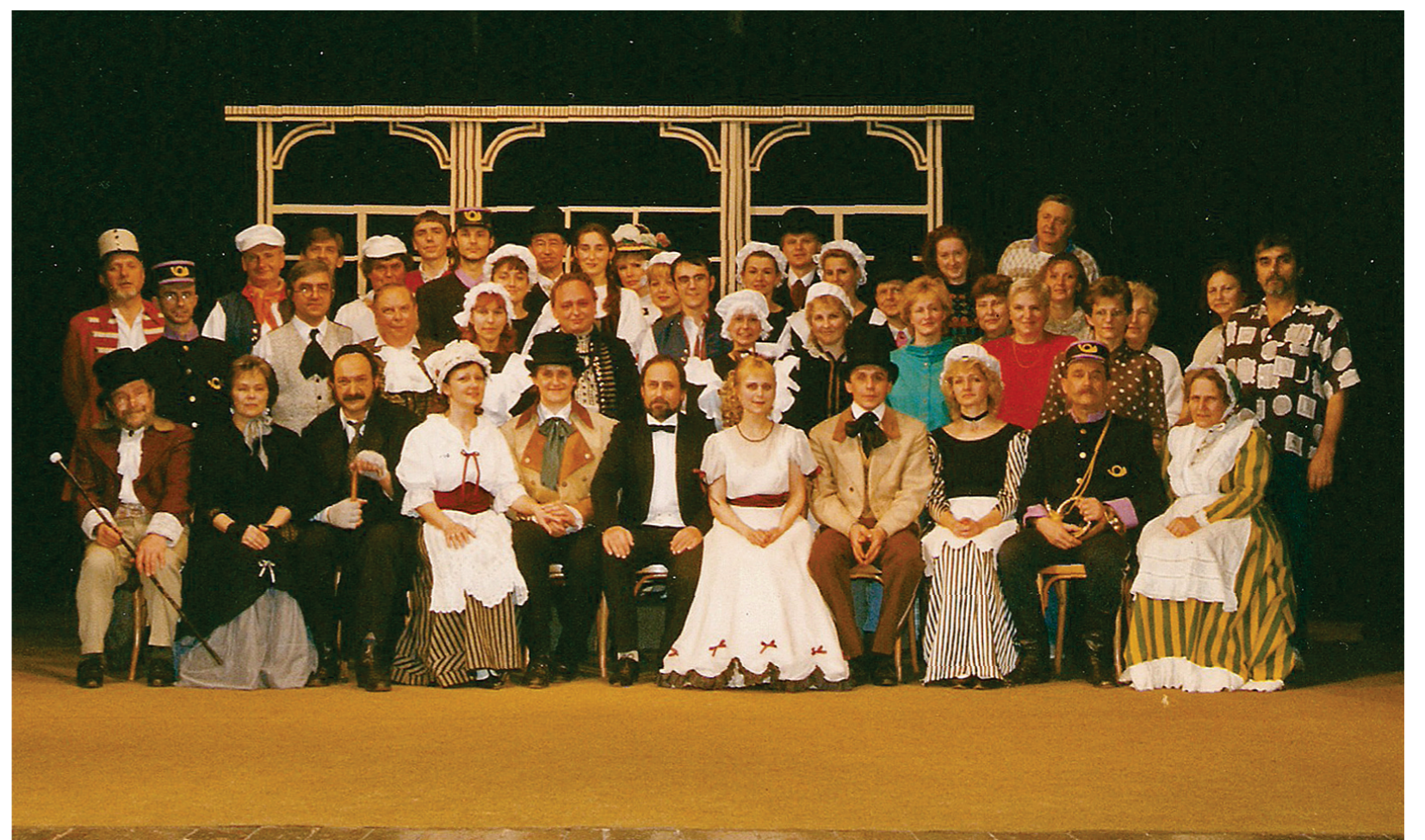
1998 - R. Piskáček: Perly panny Serafinky