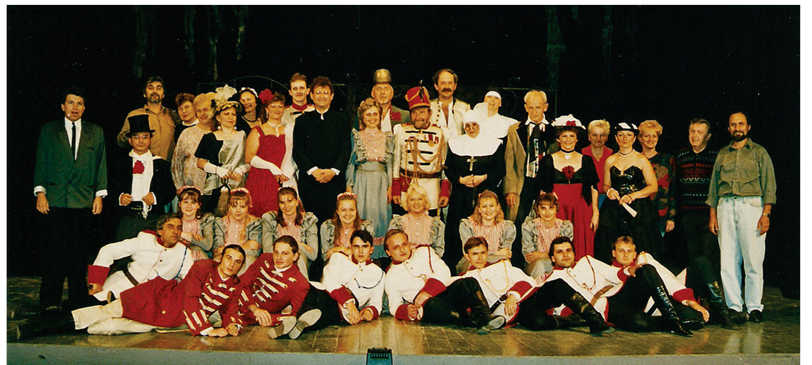
1996 - F. Hervé, H. Meilhac, A. Millaud: Mam'zelle Nitouche