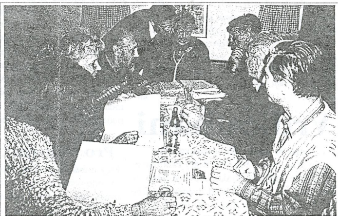
JEDNI Z POSLEDNÍCH BAFUŇÁŘŮ V ČECHÁCH, PRVNÍ VOJSKOČEK

(Pozn. U nás v souboru a u fotbalistů se funkcionářům říkalo bafuňáři. Byli to lidi, co byli schopní vyprat štulpny nebo srovnat rekvizity, ale taky objíždět soubory po kraji a vůbec... Teď jako by ochotnické divadlo mělo jen dvě profese: herec a režisér, a to ještě v lepším případě. Nemá to málo?) -sg-