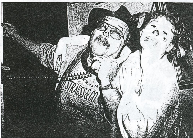
DCERA SE ŠAŠŮLDOU - ANEB VŠICHNI SE JEDNOU SEDĚME V TANEČNÍCH !!