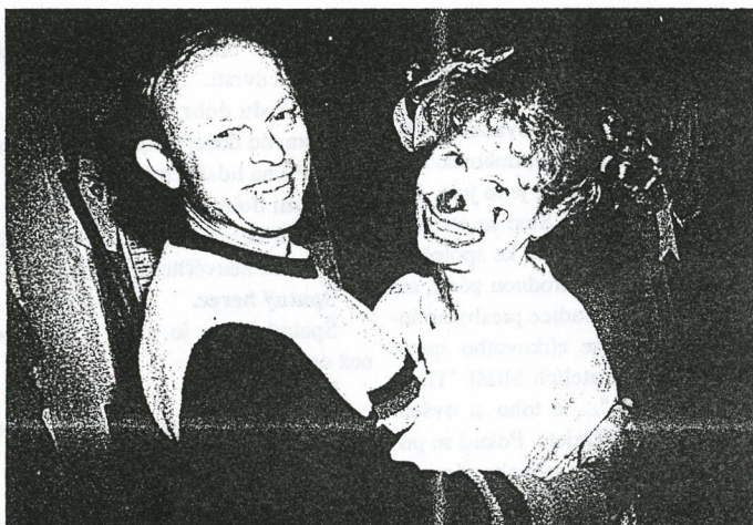
ŠAŠŮLDA S OTCEM

Z fotek, které zbyly na stole aneb z událostí třetího dne