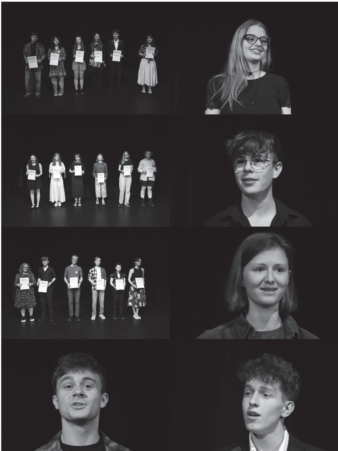
recitátoři 1. kategorie