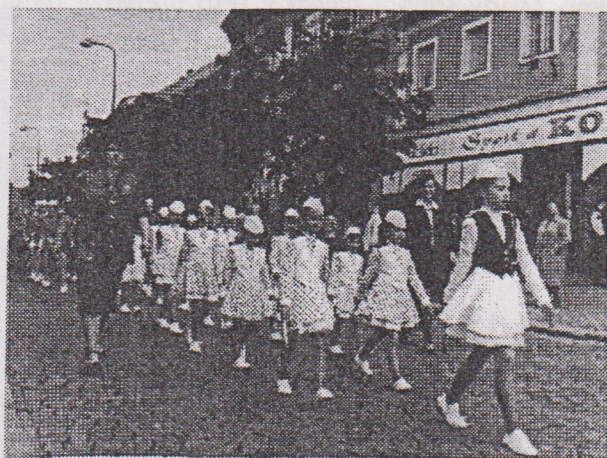
Nejmladší mažoretky byly ozdobou průvodu.

Chválíme třebíčské, jejich organizační talent, dovednost a vůli tuto přehlídku uspořádat.