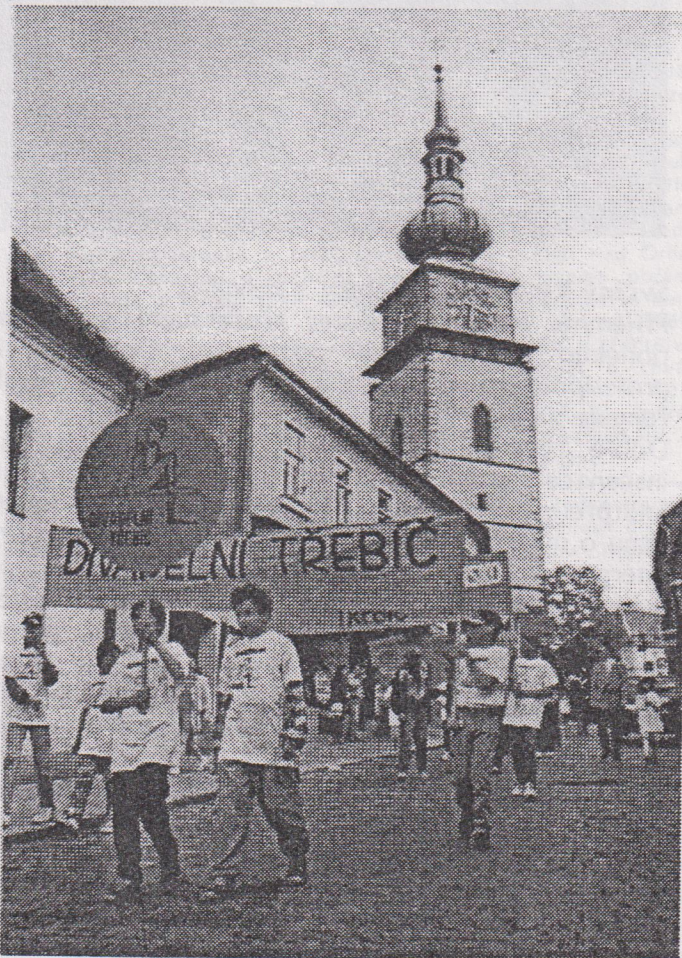
Zahajovací průvod procházející Hasskovou ulicí minutu po půl čtvrté.

S příjemným vánkem a sluníčkem připochodovalo na náměstí třebíčské divadelní jaro.