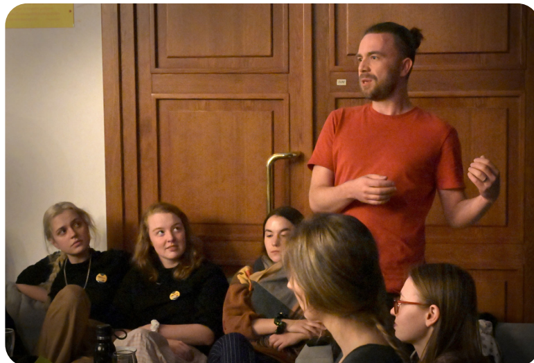
Rozborový seminář LABYRINT SVĚTA A RÁJ SRDCE

15.30, foyer Slavnostní zakončení Popelky Rakovník 2023, vyhlášení výsledků a předání ocenění