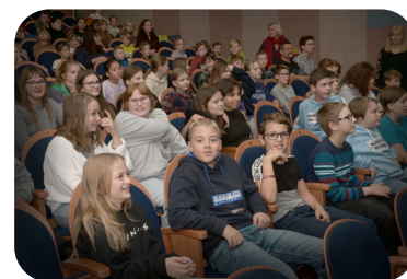
Diváci Popelka 2023