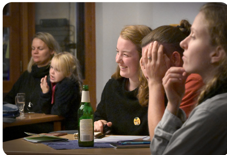
Rozborový seminář ZADLUŽENÁ PRINCEZNA