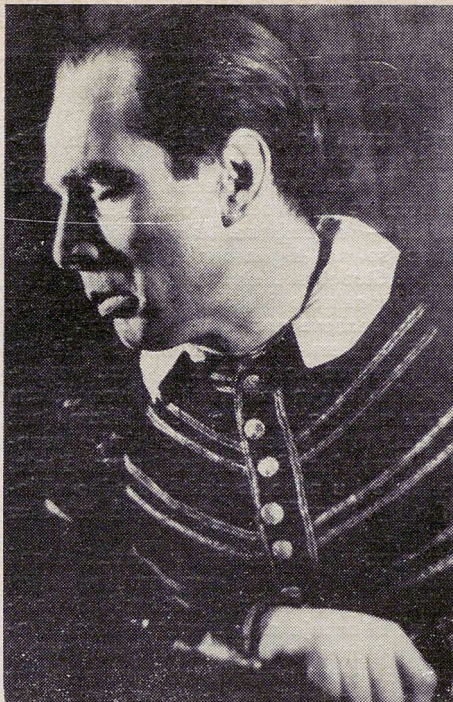
V roli Jaga ještě jako ochotník