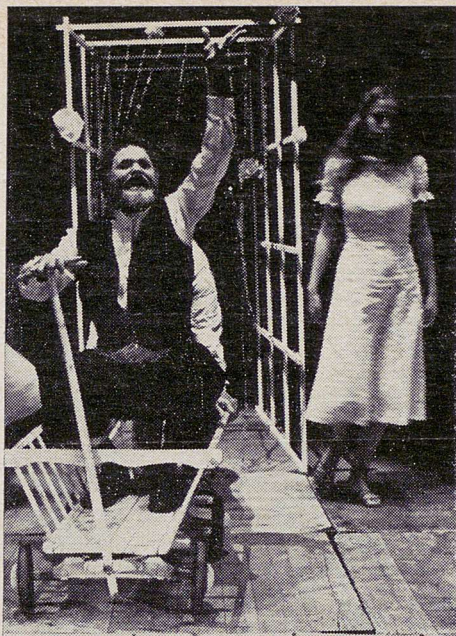
Záběr z představení souboru Orfeus.

Jak je to s profesionální pomocí amatérům?