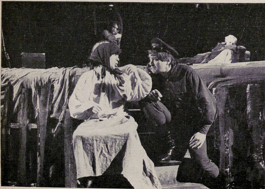
Záběry z inscenace divadelního souboru Gong — Slon od sovětského autora Alexandra Kopkova.

Samozřejmě ne vždy se personálními změnami otrášený soubor divadla Gong dokázal vyrovnat se stylizací, atmosférou i skrytou alegorickou a útočnou aktualizací textu samého. Pochvala budiž vznesena na režijní vedení: většina sekvencí hry je nesená v onom opojném