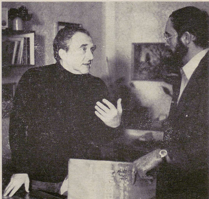
Herec Jiří Hálek s jedním z pedagogických pracovníků při natáčení filmu.